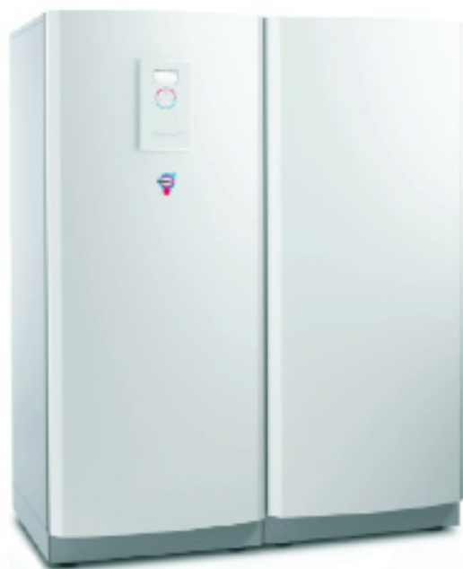
Figura 1. Bomba de calor geotérmica Thermia Diplomat Duo Optimum 16