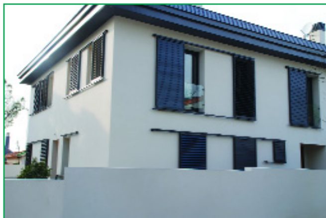
Vivienda en Pozuelo de Alarcón (Madrid) con geotermia

Buen ejemplo de este sistema es la vivienda que Girod Geotermia dispone como casa piloto para el seguimiento de un caso real, situada en Pozuelo de Alarcón, Madrid.