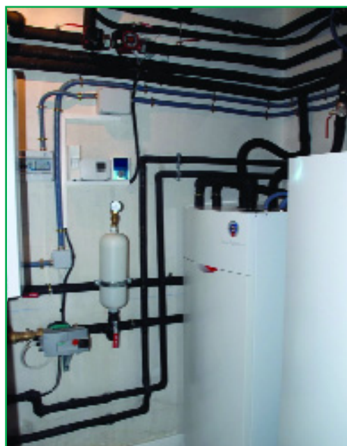
Cuarto de máquinas.

A día de hoy no existe ninguna otra fuente de energía renovable que sea capaz de aportar el 100% de las necesidades de climatización y