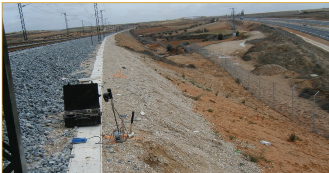
Ensayo PANDA2 en terraplén de Línea de Alta Velocidad