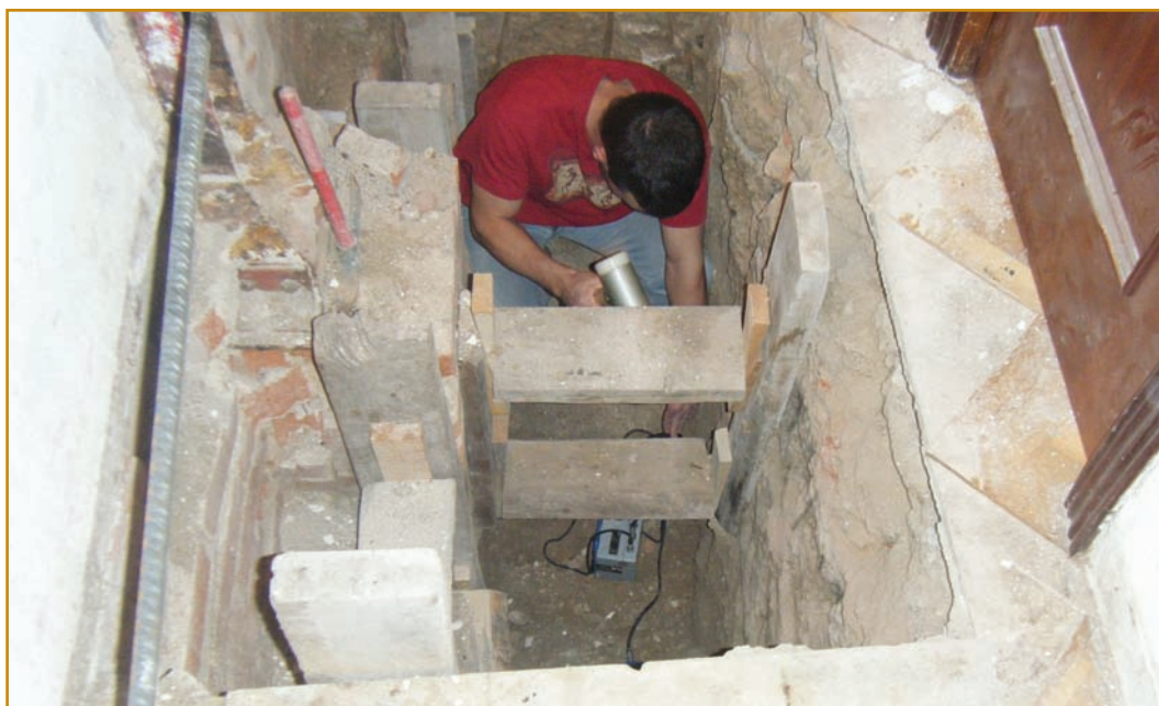
Ensayo PANDA2 en el fondo de cimentación de un edificio