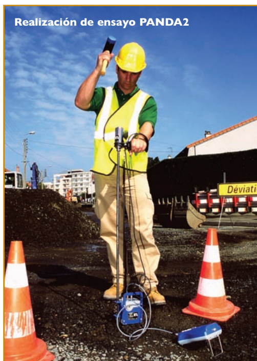
Realización de ensayo PANDA2

dureza del material atravesado pero, a título indicativo, se puede estimar en un metro de penetración por cada 10 minutos de ensayo.