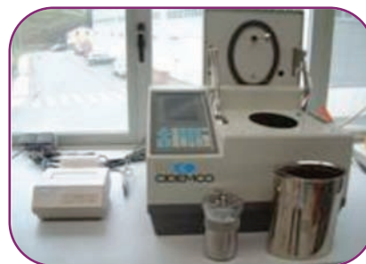
Dispositivo de ensayo de bomba calorimétrica

* PCS \leq 1,4 MJ/m 2 Para cualquier componente interno no sustancial de productos heterogéneos