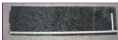
(izda) Dispositivo de panel radiante. (dcha) Muestra de una mezcla bituminosa preparada para el ensayo.