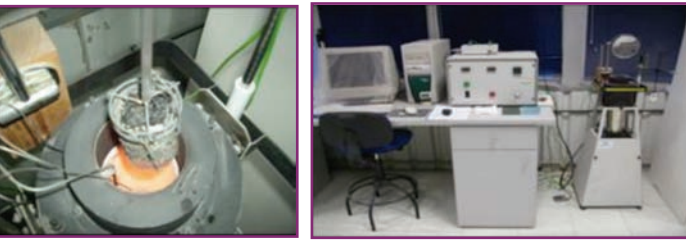
Figura 1.- (izda) Horno de no combustibilidad (dcha) Dispositivo de ensayo

materiales que, pese a no ser completamente inertes, producen sólo una cantidad muy pequeña de calor y llamas al estar expuestos a temperaturas de aproximadamente 750°C.